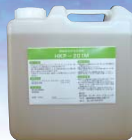
酵素配合中性洗浄剤 (無泡性・無リン) HKP-201M