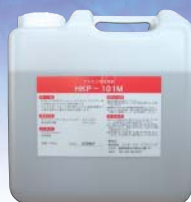
アルカリ性洗浄剤 (無泡性・無リン・アルミ対応) HKP-101M

確かな洗浄力を持つ洗浄剤と、優しく器具を保護する 潤滑防錆剤もご用意致しました。