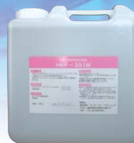
水溶性潤滑防錆剤 HKP-301M

確かな洗浄システムを創出する 株式会社 エッチ・ケイ・プランニング http://www.hkplanning.co.jp/